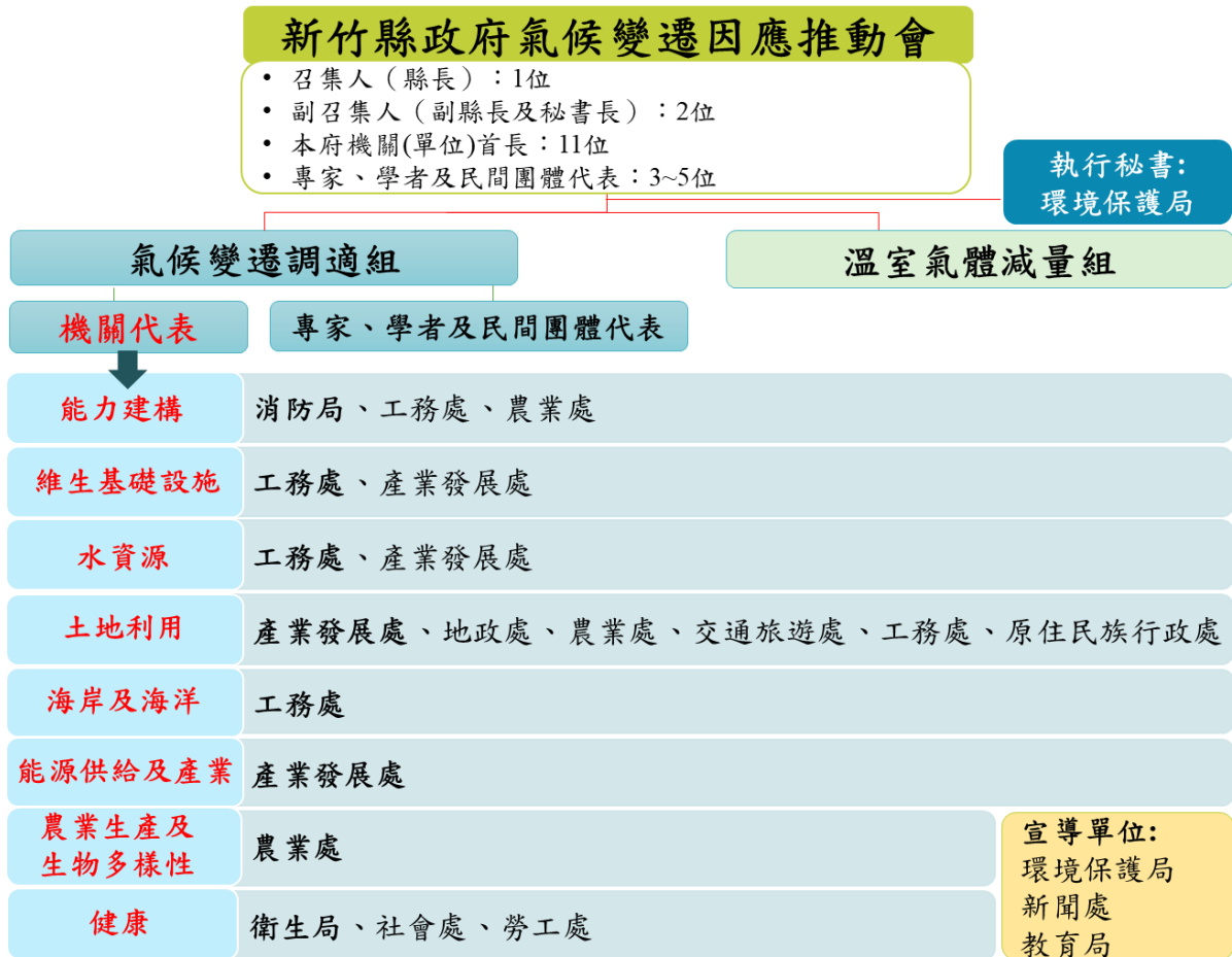
圖 1.1 新竹縣氣候變遷因應推動會及調適組成員