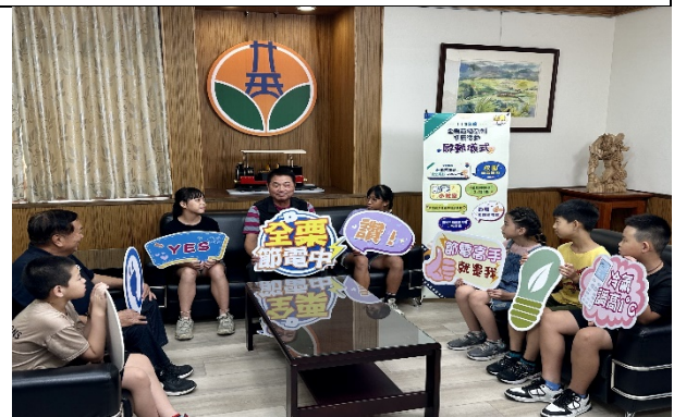
縣長鍾東錦 全栗節電系列推廣活動啟動