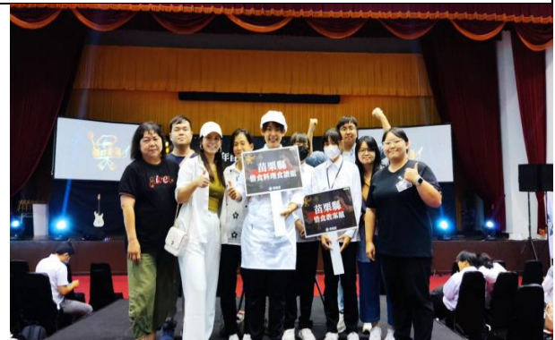
首惜廚師甄選活動全國總決賽苗栗惜食 文武兼備 教案食譜雙雙得獎