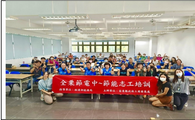
節電志工培訓 推動鄉親落實節電新生活