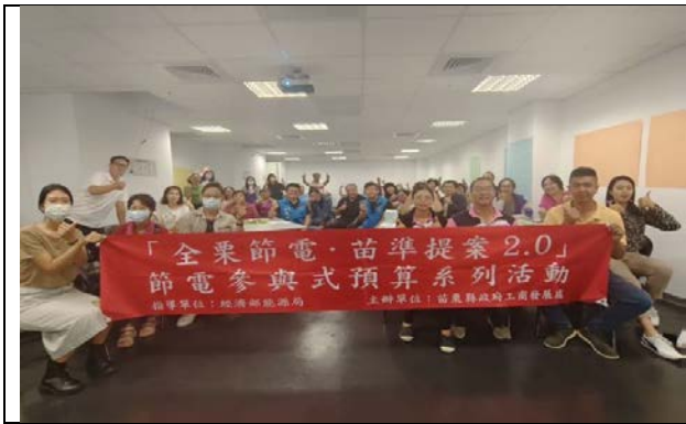
112 年度「節電參與式預算」活動