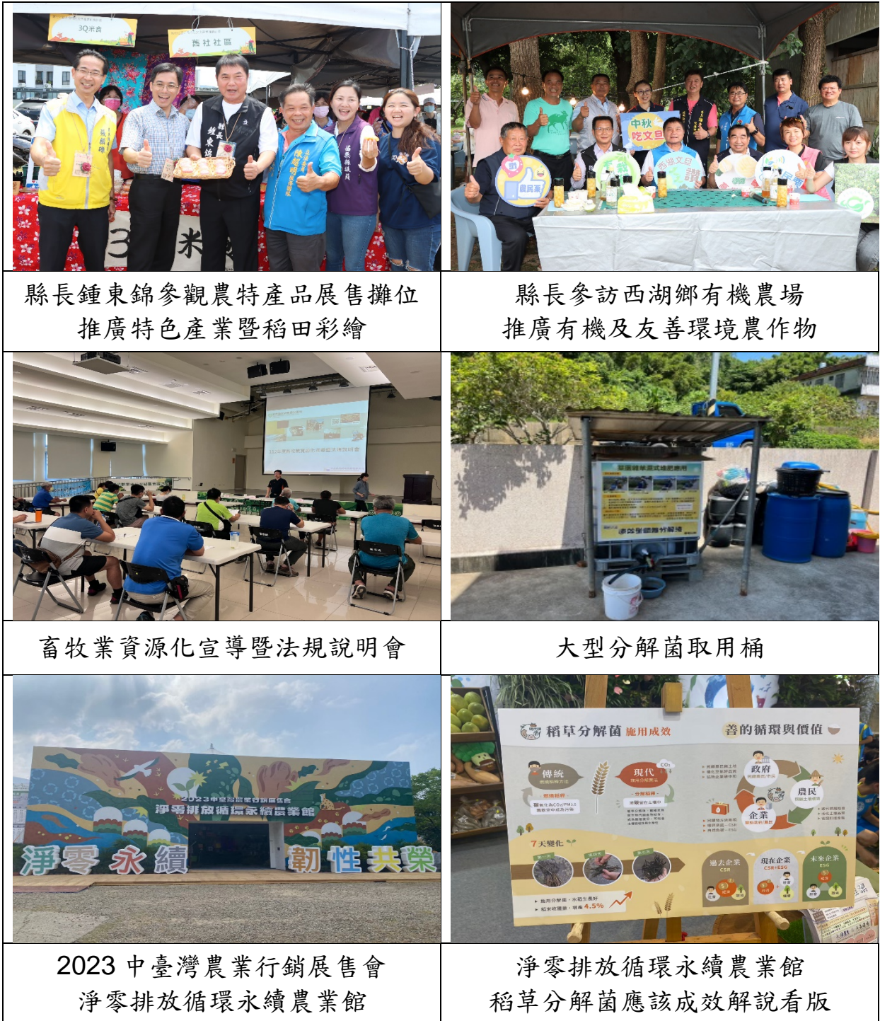
縣長鍾東錦參觀農特產品展售攤位 推廣特色產業暨稻田彩繪