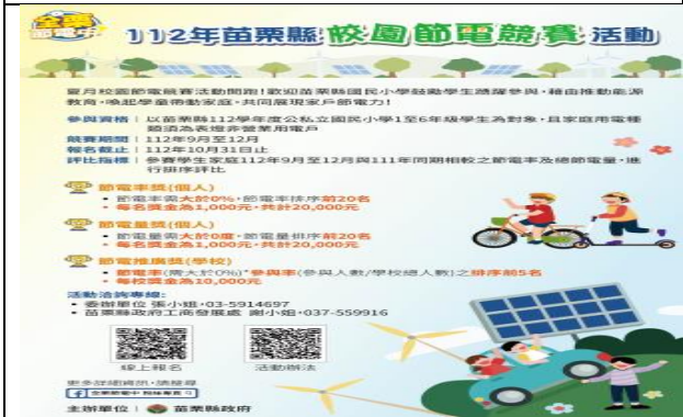
苗栗「校園節電競賽」海報 鼓勵轄內公私國民小學串起校園與家庭，共譜節電行動網絡