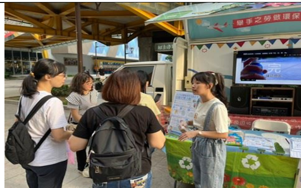
高壓容器兌換宣導活動