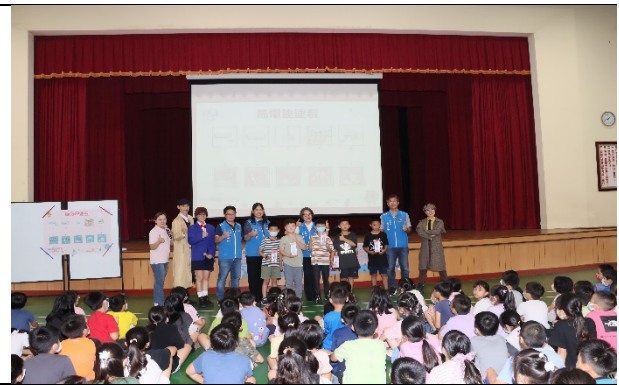
副縣長訪視校園節電小教室課程