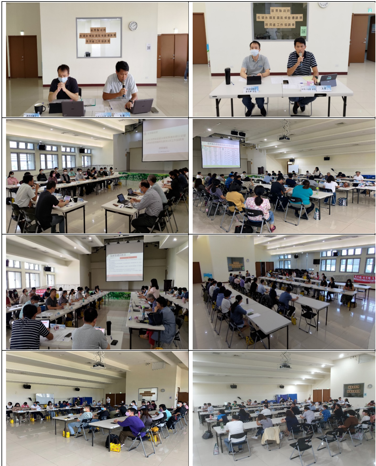
圖 2 112 年跨局處整合協調會議暨苗栗縣氣候變遷因應推動會會議照片