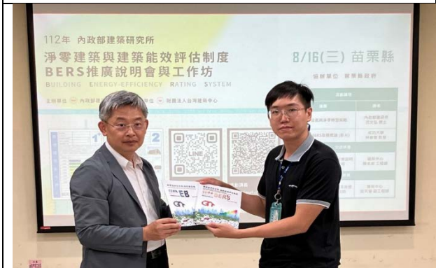
淨零建築與建築能效評估制度 推廣說明會與工作坊