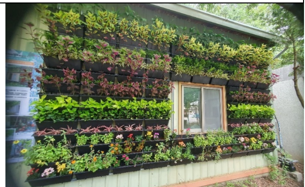
推動村里社區「綠化補助」