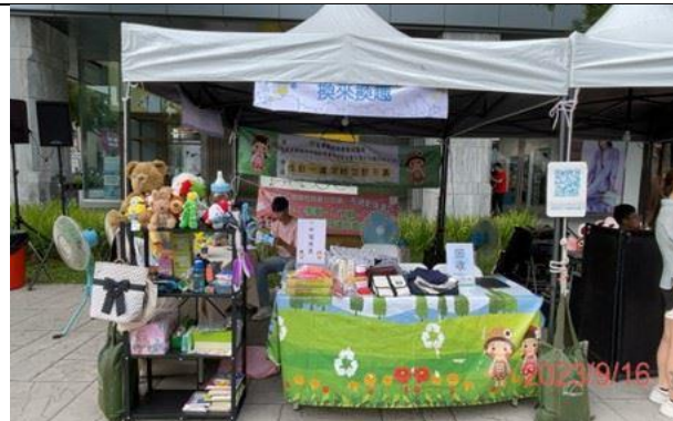
二手物市集活動 鼓勵民眾落實淨零綠生活