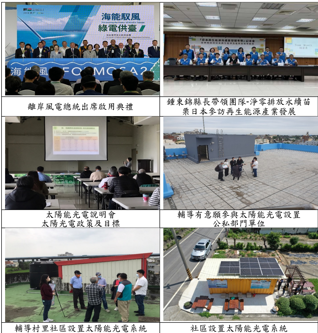
圖 4 能源部門推動情形