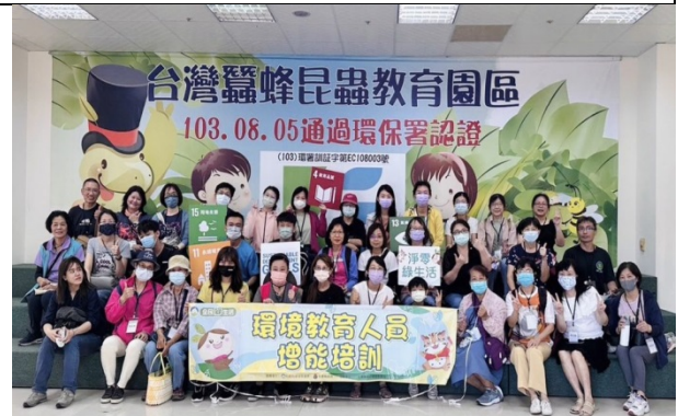
環境教育增能培訓 提升專業知識與技能規劃實務課程能力與想法