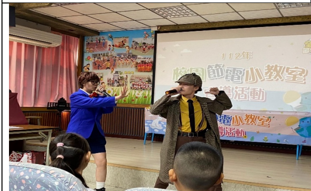
校園節電宣導活動