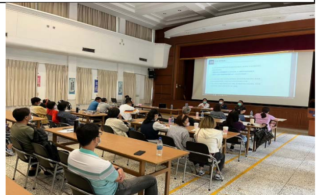
提升廚餘回收工作檢討會