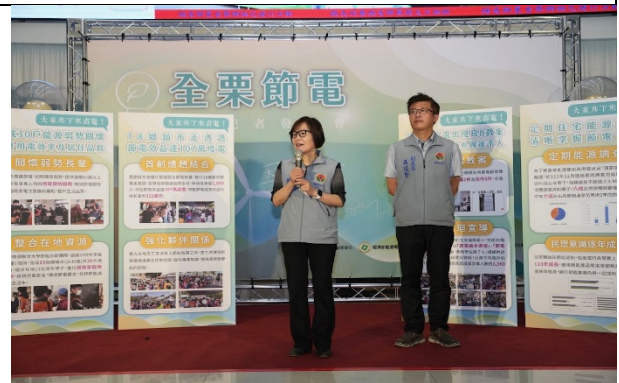
全栗節電成果 苗準永續發展