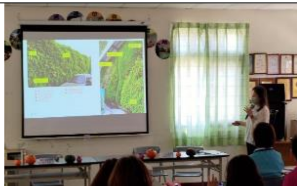
綠化降溫培訓及空品淨化區宣導