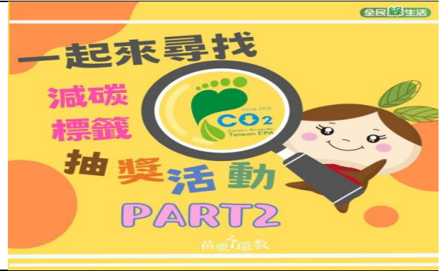
「尋找減碳標籤」線上抽獎活動