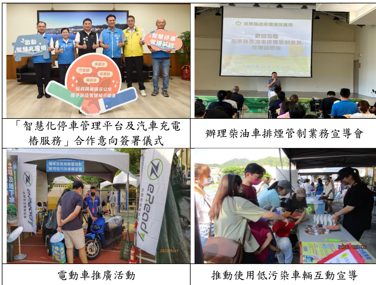
圖 6 運輸部門推動情形

(4) 串聯低碳運輸系統，將步道、自行車、電動汽車、台灣好行等，納入本縣觀光旅遊地圖規劃，並透過計畫性行銷宣傳，引導遊客落實低碳旅遊、輕環保旅行目標。