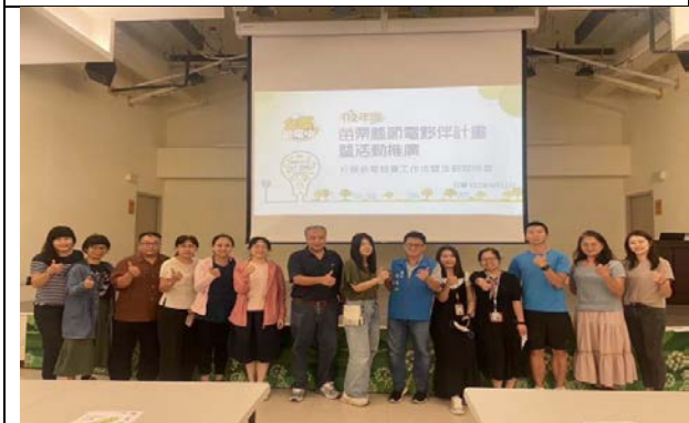
苗栗校園節電競賽工作坊