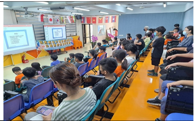
海洋環境教育宣導活動 減少塑料污染環境保育觀念向下扎根