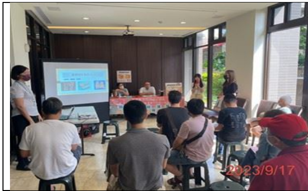
推動公寓大廈社區的垃圾分類 與資源回收觀念