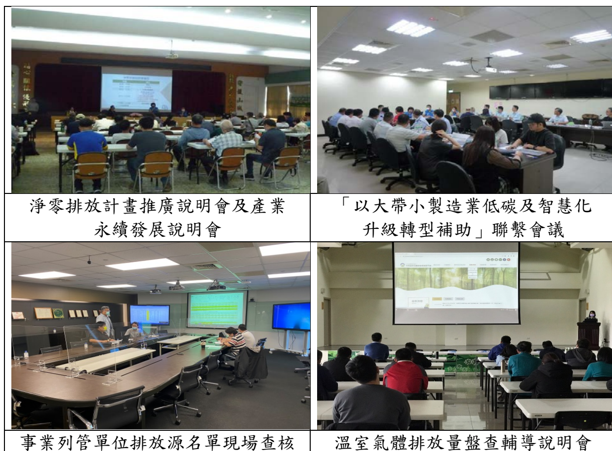
圖 3 製造部門推動情形