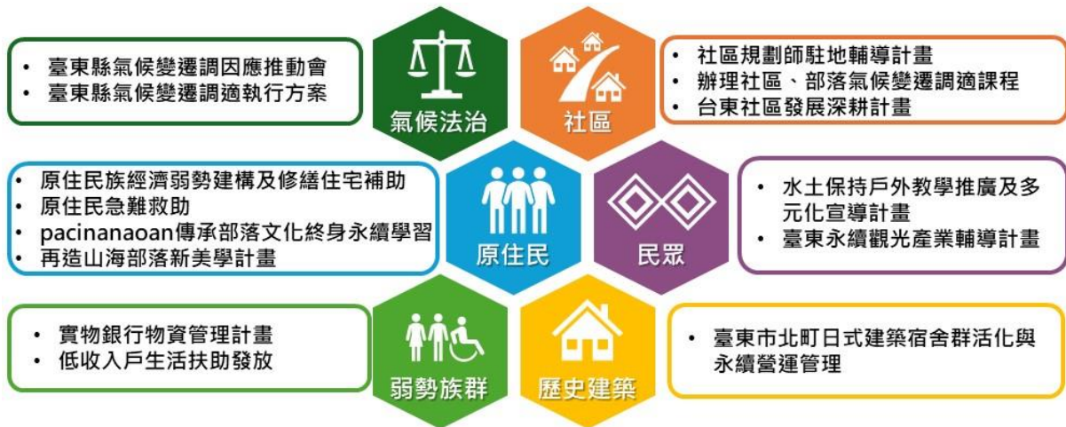
圖 4-2 臺東縣氣候變遷調適執行方案推動策略(能力建構)

臺東縣氣候變遷調適執行方案，就氣候變遷七大領域外，針對不同受氣候變遷影響群體，以能力建構方式提出相關推動策略。包含以社區群體為對象辦理社區規劃師培力課程(建設處)、社區/部落氣候變遷調適課程(環保局)、台東社區發展深耕計畫(社會處)；以弱勢族群為對象的實物銀行物資管理計畫、低收入戶生活扶助發放；以原住民族群為對象辦理原住民族經濟弱勢建構及修繕住宅補助、原住民急難救助、pacinanaoan 傳承部落文化的終身永續學習計畫等，共計提出 17 項調適推動策略，能力建構推動策略詳表 4-2。