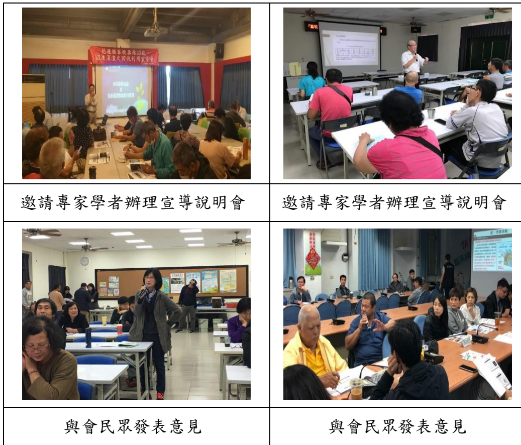
圖 1 推廣初期請畜牧業者參加宣導說明會

106 年規劃於花蓮縣玉里鎮三民畜牧專區設置畜牧糞尿資源化處理沼氣發電設施(璞石閣生質能源中心) 集運收集 8 間畜牧場共 9,530 頭豬隻及 697 頭牛隻產生的糞尿進行處理，為全國首座畜牧糞尿集中處理沼氣發電示範點。目前該廠收集畜牧場所產生的糞尿、廢水，經由厭氧發酵產生沼氣，收集作為發電使用，初期投入沼氣發電 8 家畜牧業者，豬隻 9,530 隻，牛 697 隻，每年估計可產生約 80 萬度電以上，相當於 250 戶住家用電量。