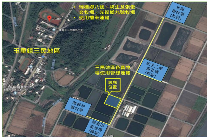
圖 2 璞石閣生質能源中心及集運畜牧場位置圖