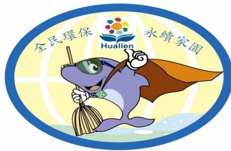
花蓮環保吉祥物—環保海豚