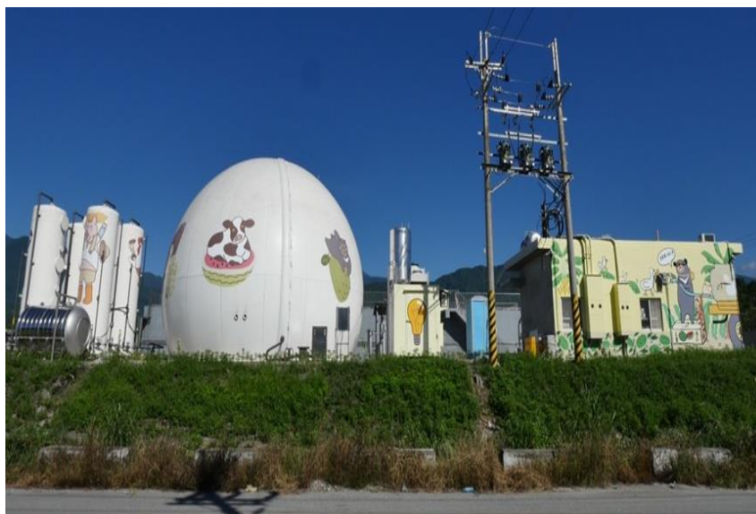
圖 3 璞石閣生質能源中心