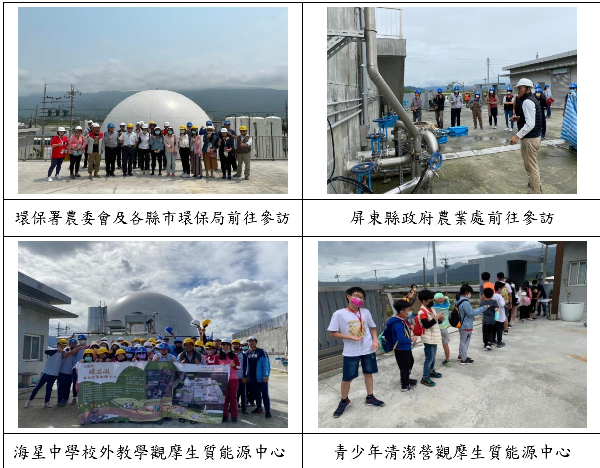
圖 5 各單位參訪璞石閣生質能源中心