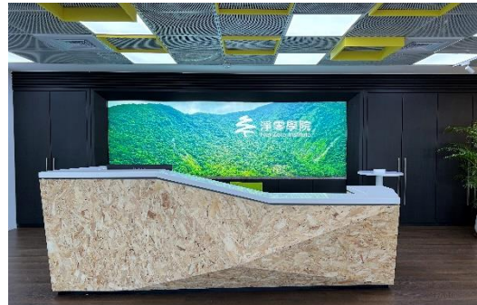
圖 27 淨零學院實景