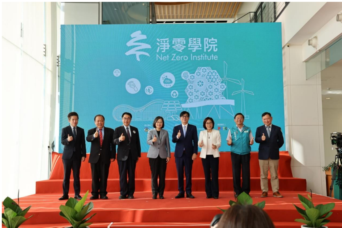
圖 25 淨零學院 112 年 11 月 6 日開幕

除了產業外，學院也將培育政府淨零人才，未來包含基層同仁、中高階主管，甚至局處首長都需要至學院受訓如圖 26，將系統性推動一、二級機關人員受訓，另外，學院亦將與南方六縣市合作，包含台南縣、屏東縣、嘉義縣、嘉義市、台東縣、澎湖縣，共同推動人才培育。淨零學院教室實景如圖 27。