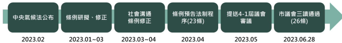
圖 23 淨零城市發展自治條例訂定歷程

「高雄市淨零城市發展自治條例」訂定強調社會、產業溝通，多次召開座談會、公聽會、專家諮詢會進行討論，條例於 112 年 6 月 28 日經市議會三讀通過，係「氣候變遷因應法」公布以來，全國第一部地方淨零自治法規，目前中央正審議當中，期望透過自治條例，做為各項淨零政策運作之基礎。