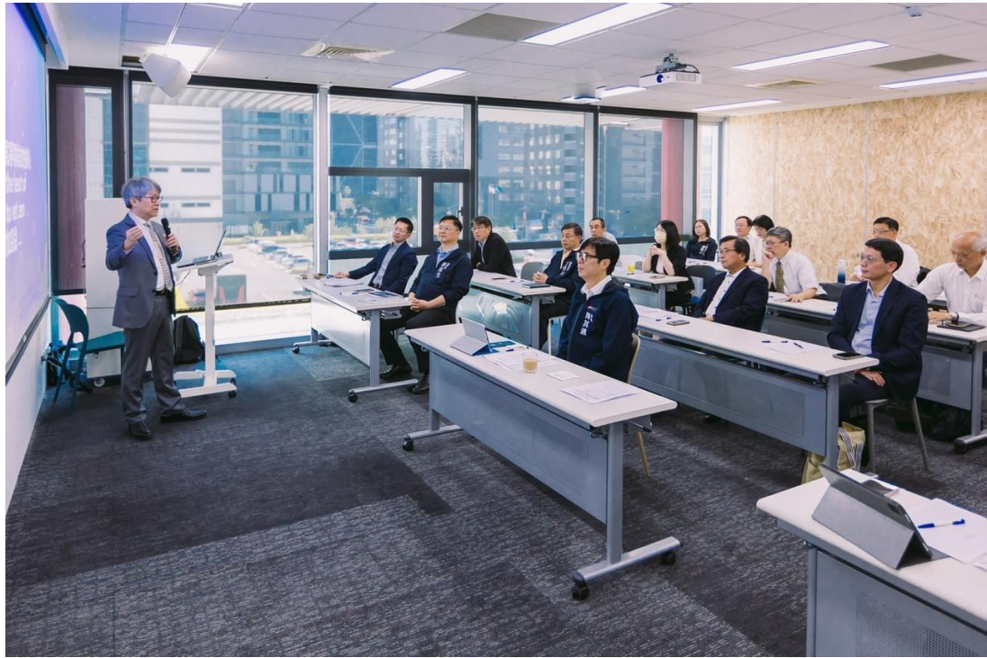
圖 26 陳其邁市長率局處首長至淨零學院上課