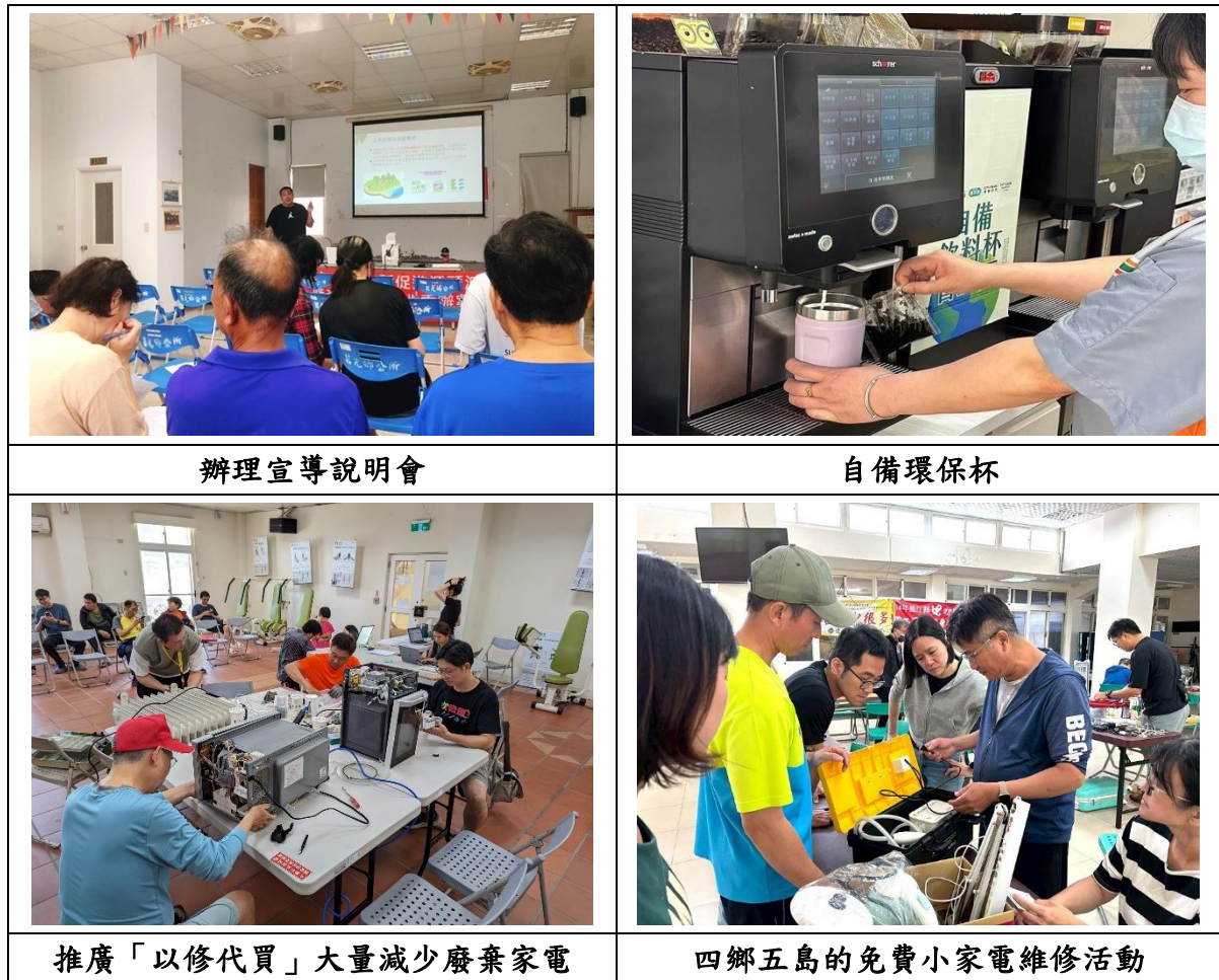
圖 2.3-9 推廣減少廢棄物產生相關宣導活動

此外，因家電產品普及與價格下降，馬祖地區家電廢棄量逐年增加。為促進資源循環再利用，環境資源局於 114 年 5 月舉辦「四鄉五島免費巡迴小家電維修活動」，邀請北、中、南區專業維修團隊提供現場檢查、簡易維修與保養教學，並推廣「以修代買」理念。該活動落實惜物精神與循環經濟原則，延長家電使用壽命、減少廢棄物產生，具體展現生活層面實踐環境永續之成果(如圖 2.3-9 所示)。