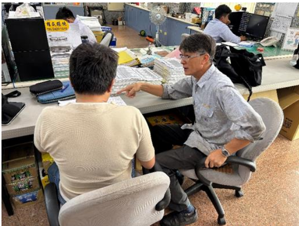
場所：臺灣電力(股)公司馬祖區營業處-莒光電廠