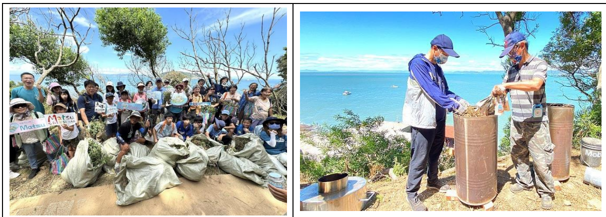
圖 2.3-12 輔導社區將玉珊瑚燒製成生物炭直接回歸生產循環

為防止玉珊瑚擴散，所有拔除植株均留置島上，經工作人員製成生物炭，用於改善土壤及水質，落實循環利用與低碳環境管理原則。縣府亦呼籲遊客在欣賞大坵自然景觀的同時，踴躍參與拔除外來種與播種原生植物之行動，共同守護島嶼生態，實踐環境永續理念(如圖 2.3-12 所示)。