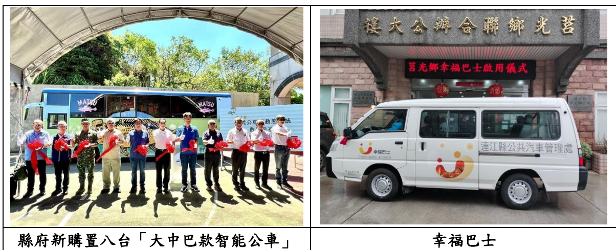
圖 2.3-6 本縣提升公共運輸發展

至 113 年底，縣府完成採購八輛「大中巴款智能公車」，其中兩輛以「黃魚」為主題進行車身彩繪，並於 114 年 9 月正式投入營運。此舉除強化公共運輸能量外，亦結合藝術與文化意象，營造獨特的在地風貌，使公共運輸成為展現地方創新與文化特色的移動舞台。透過新型車輛導入與行銷推廣，本縣公共運輸服務正穩健邁向低碳化與多元化，不僅提升旅客搭乘率與服務便利性，亦有效減少私人運具使用及碳排放，展現交通運輸與文化永續並進之成果(如圖 2.3-6 所示)。