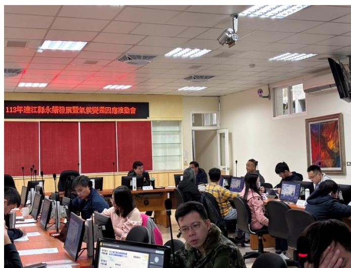
圖 2.3-1 本縣辦理「溫室氣體管制執行方案研商會議」

研商會議除檢討現行管制方案之妥適性外，並邀請兩位具氣候變遷與溫室氣體管理專業之學者專家擔任顧問，提供具體減量建議及未來推動方向。於 113 年度共舉辦兩場研商會議及一場會前座談會，廣納各界意見，作為後續方案滾動檢討與修正之依據(如圖 2.3-1 所示)。