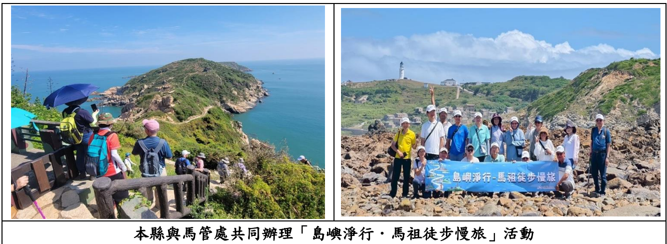
圖 2.3-7 辦理「島嶼淨行-馬祖徒步慢旅」活動

為推廣馬祖獨特島嶼魅力，並與國際永續旅遊趨勢結合，馬管處發起「島嶼淨行·馬祖徒步慢旅」永續觀光倡議，邀請旅遊業界共同響應，推動馬祖成為亞洲領先的徒步旅遊天堂(如圖 2.3-7 所示)。