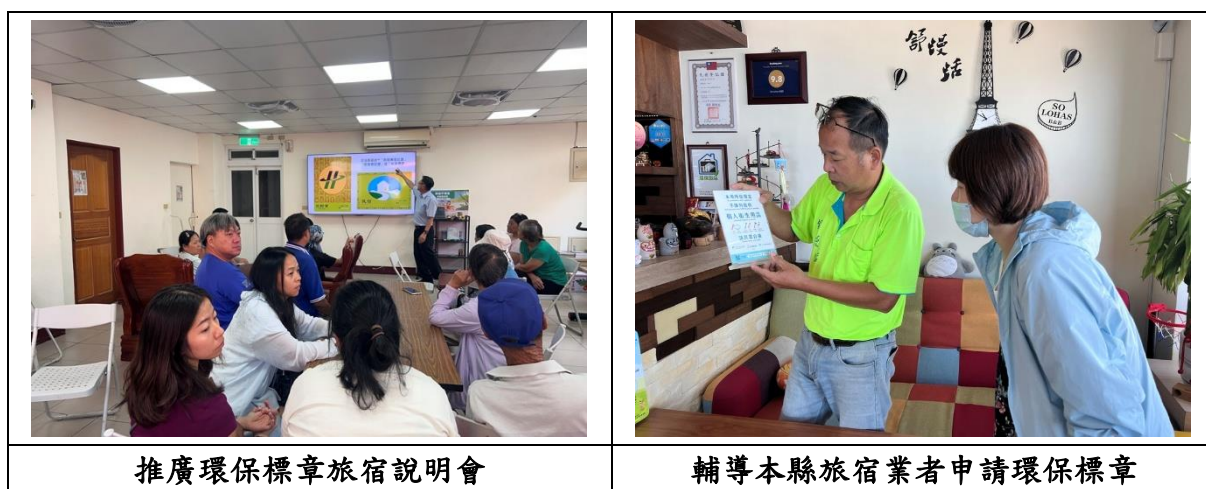
圖 2.3-8 推廣「環保標章旅宿說明會」

展望未來，連江縣將持續以「綠色旅遊典範」為目標，鼓勵更多業者採行環保經營模式，使本縣旅遊服務更符合現代環保趨勢。同時期盼透過綠色旅遊推廣，提升居民與旅客之環保意識，促進地方經濟與環境永續共榮發展。