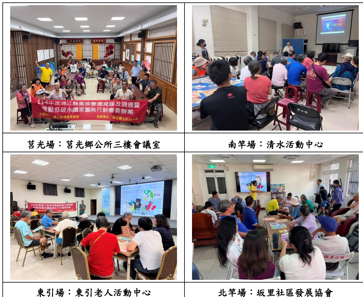
圖 2.3-3 辦理低碳永續家園行動項目之相關宣導課程

行政院於 111 年 1 月 10 日核定住商部門 114 年溫室氣體排放量目標為 41.421 百萬公噸 CO 2 e，較基準年下降 27.9%。為配合中央政策，連江縣 113 年辦理節電稽查與診斷輔導計畫，實施 20 家次「指定能源用戶應遵行之節約能源規定」檢查，包含節約能源三項規定「冷氣不外洩」、「禁用鹵素燈泡及白熾燈泡」及「室內冷氣溫度限值」是否符合規範進行查核及宣導，且針對不符節能規定特定用戶進行輔導作業。