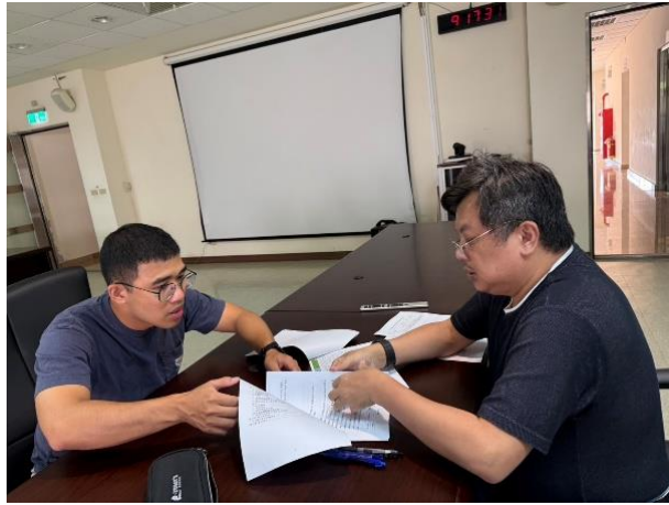
場所：臺灣電力(股)公司協和發電廠馬祖珠山分廠-珠山機組暨臺灣電力(股)公司協和發電廠馬祖珠山分廠-南竿機組