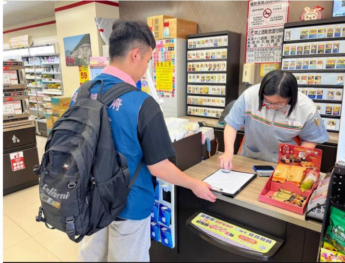
圖 2.3-4 辦理節電稽查與診斷輔導

另亦積極推動全民參與式預算，協助推動本縣轄區內與能源相關的族群和場域，提升用電品質並推廣節電觀念。透過在地性和草根性的民主方式，鼓勵公民廣泛參與，集思廣益並進行多方溝通與討論，產出反映在地需求的節能減碳方案。