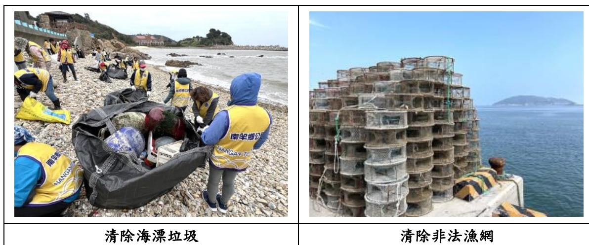
圖 2.3-11 海漂(底、岸)垃圾清除處理