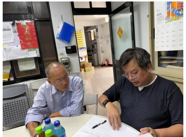
場所：臺灣電力(股)公司馬祖區營業處-東引電廠