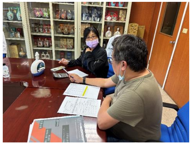
場所：馬祖酒廠實業股份有限公司-南竿廠