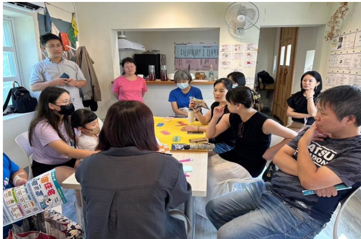
圖 2.3-5 辦理全民參與式預算工作坊

另亦積極推動全民參與式預算，協助推動本縣轄區內與能源相關的族群和場域，提升用電品質並推廣節電觀念。透過在地性和草根性的民主方式，鼓勵公民廣泛參與，集思廣益並進行多方溝通與討論，產出反映在地需求的節能減碳方案。