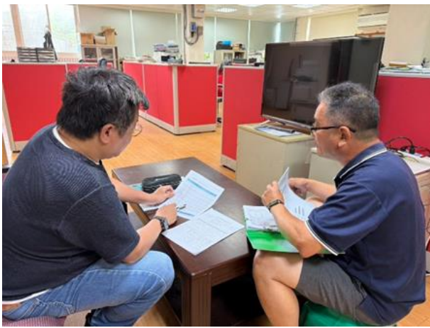
場所：馬祖酒廠實業股份有限公司-東引廠

透過持續培訓與經驗交流，強化各單位對盤查作業的理解與執行能力，確實掌握轄內溫室氣體排放資料，並得以進一步評估排放量之合理性與準確度(如圖 2.3-2 所示)。