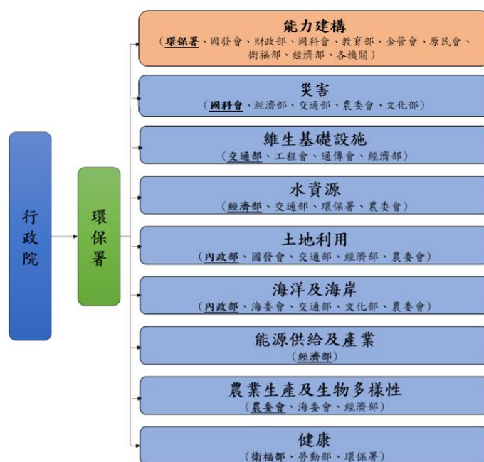
圖 1. 國家氣候變遷調適分工

本期方案延續「國家氣候變遷調適行動計畫（102-106 年）」所劃分之 8 項調適領域，再增加能力建構領域；同時研提 125 項調適行動計畫，其中 87 項為需持續推動之延續性計畫，38 項為本階段行動方案中新增之計畫，其領域分工為：能力建構 - 環保署；災害 - 國家科學及技術委員會（以下簡稱國科會）；維生基礎設施 - 交通部；水資源 - 經濟部；土地利用 - 內政部；海洋及海岸 - 內政部；能源供給及產業 - 經濟部；農業生產及生物多樣性 - 行政院農業委員會（以下簡稱農委會）；健康 - 衛生福利部（以下簡稱衛福部）（如圖 1）