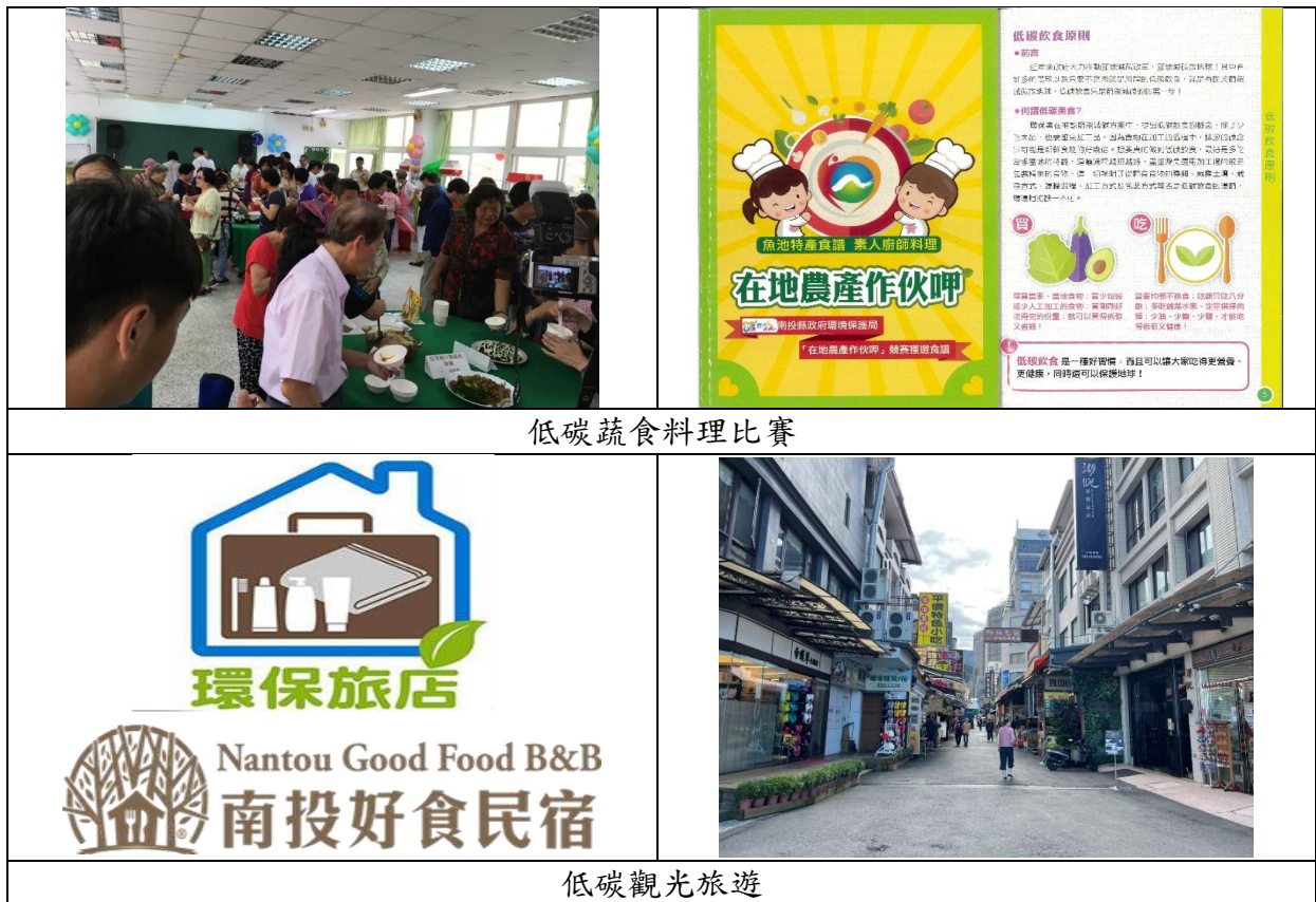
圖 6、溫室氣體減量推動策略示意圖 (1/2)

由於南投縣為觀光大縣，因此未來在溫室氣體減量作法上，將以低碳生活面向進行規劃，預計 111 年度將辦理低碳蔬食料理比賽、低碳村里社區攝影比賽、低碳觀光旅遊等活動，並輔導轄內各機關、社區設置雨水貯留再利用系統（或雨撲滿），或配合區域降溫補助屋頂綠化或垂直綠化等作業，有效降低溫室氣體排放量，達成永續發展之目的。