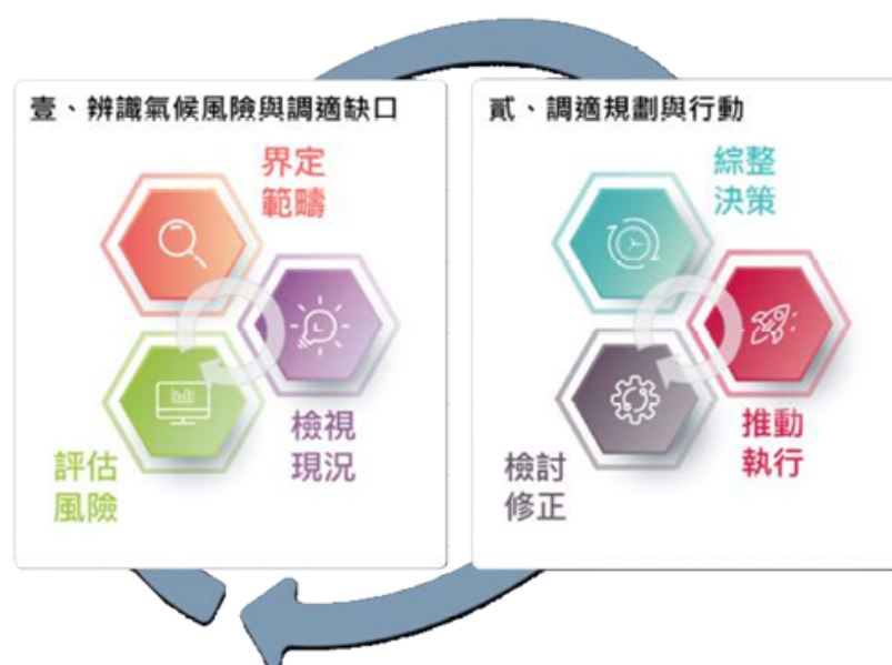
圖 1.2 二階段調適框架及其操作步驟

由於各調適領域或行動計畫執行進度、科研基礎、評估因子複雜度有所不同，若尚無法直接進行調適行動規劃或落實調適行動之機關，需著重新於第壹階段之盤點現行基礎量能、評估氣候風險與缺口辨識，做為後續第貳階段擬定調適策略之依據。若前期已進行現況盤點與氣候變遷風險之機關，則針對風險與調適缺口於第貳階段進一步研擬調適策略與計畫，並訂定追蹤指標定期監測，以利於計畫結束後檢討執行效益，並持續滾動修正。