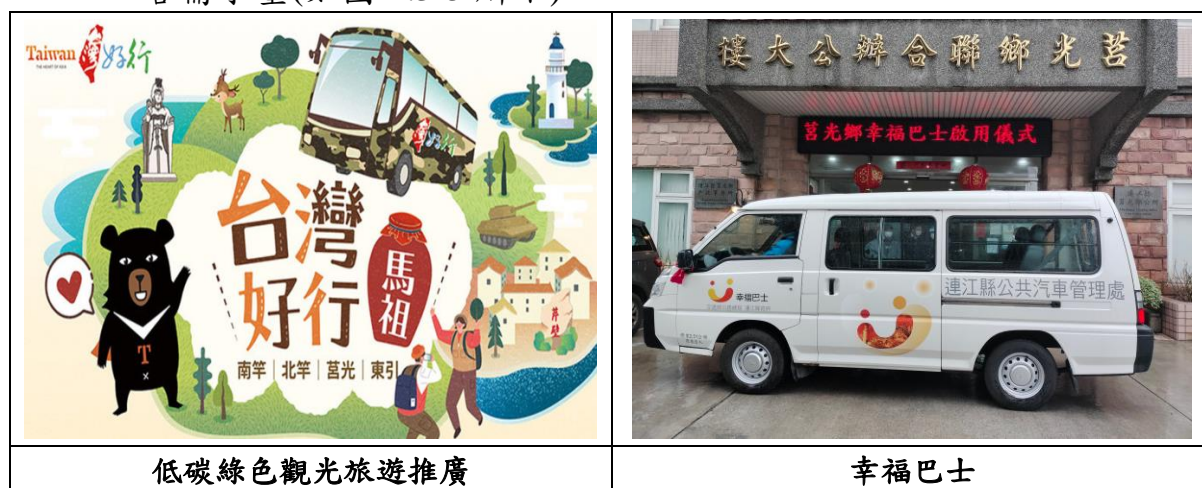
圖 2.3-5 本縣提升公共運輸發展

目前本縣公車營運路線有南竿鄉及北竿鄉的山線與海線，莒光鄉東、西莒的幸福巴士每天各 7 班，各線班車主要配合學生上、下學及旅客搭乘飛機、船舶為主，觀光客為輔；另外本縣亦有台灣好行 4 條路線(8 班次)加入載客行列，目前已滿足現有載客需求量(如圖 2.3-5 所示)。