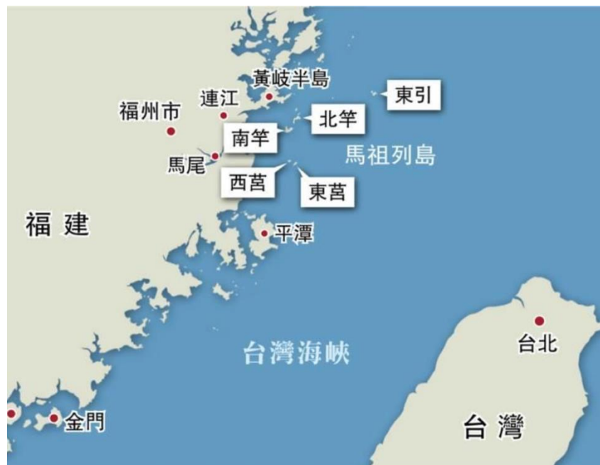
圖 2.1-1 連江縣地理區位示意圖

連江縣位於臺灣西北方的臺灣海峽上，由 36 個島嶼組成，包括：南竿、北竿、東莒、西莒、東引、亮島、高登、大坵、小坵以及許多無人島嶼，形成東西窄、南北狹長的地形，總面積約為 29.6 平方公里，海域面積約占 6,500 平方公里，連江縣島嶼地形主要分為海岸地形、河谷地形、丘陵地形與平台地形，其中海岸及丘陵地形占大部分面積，河谷以及平台地形面積則不大，其與台灣本島地區具有顯著差異，進而造就了連江縣地景之獨特性。南竿為連江縣之第一大島，也是連江縣的政經文教中樞。其距離中國福建的閩江口僅有 5.4 海浬，過去被譽為上天灑在閩江口的一串珍珠。連江縣行政區域下轄 4 鄉(南竿鄉、北竿鄉、東引鄉以及莒光鄉)22 村，其地理區位如圖 2.1-1 所示：