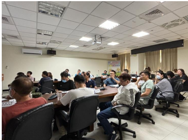
圖 2.3-1 本縣辦理「溫室氣體管制執行方案研商會議」

為規劃溫室氣體管制執行方案內容及執行可行性，連江縣政府每年度藉由辦理溫室氣體管制執行方案研商會議，透過邀集各局處單位部門，包含機關、教育、製造、運輸、能源、住商與農業等，整合相關單位及其資源，共同研擬連江縣溫室氣體管制執行方案，檢討管制方案妥適與否。亦邀請專家學者與會並擔任顧問協助給予具體之減量建議、推動方向與目標，於 110 年至 112 年皆辦理 2 場次的溫室氣體管制執行方案研商會議(如圖 2.3-1 所示)。