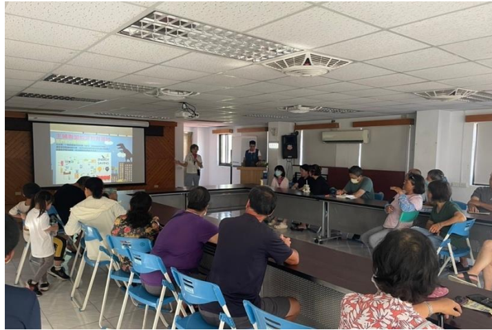
圖 2.3-4 辦理節能相關推廣工作

7.712 萬度電。依據最新公告電力排碳係數為 0.495 公斤 CO 2 e/度，預估共計節省 6.211 萬公斤的 CO 2 排放量。另本縣將持續針對各部門進行節電稽查與診斷輔導，老舊燈具汰舊換新等相關工作，以降低 CO 2 排放量(如圖 2.3-4 所示)。