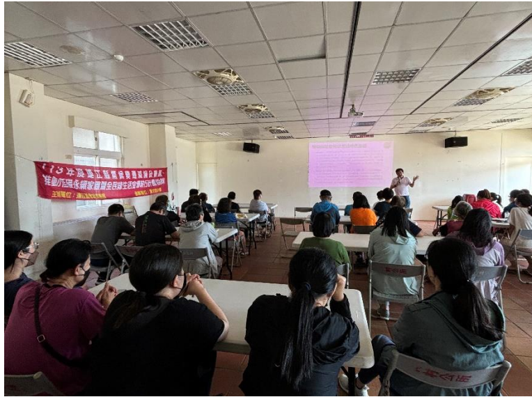
圖 2.3-6 推廣環保旅宿說明會