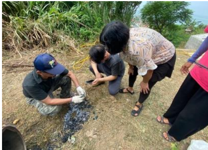
圖 2.3-10 輔導社區將玉珊瑚燒製成生物炭直接回歸生產循環

近年來，本縣除持續清除島上玉珊瑚，並思考如何將清除之玉珊瑚作更有效的利用。故本縣與環球科技大學觀光與生態旅遊系合作將被拔除玉珊瑚經由炭化過程活化再利用，形成生物炭之淨化與堆肥效果，成功將本被視為生態威脅的玉珊瑚，轉化成為能改善土壤及淨化水質的農業黑金，有利於大坵島本土植物及梅花鹿食草生長，抑制玉珊瑚的擴散，更進一步輔導社區深化循環經濟(如圖 2.3-10 所示)。