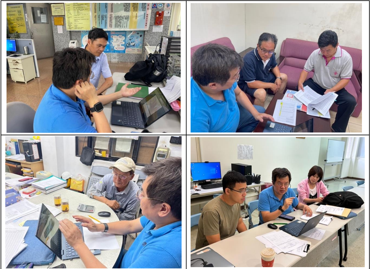
圖 2.3-2 輔導本縣溫室氣體納管對象及固定污染源進行盤查登錄作業輔導