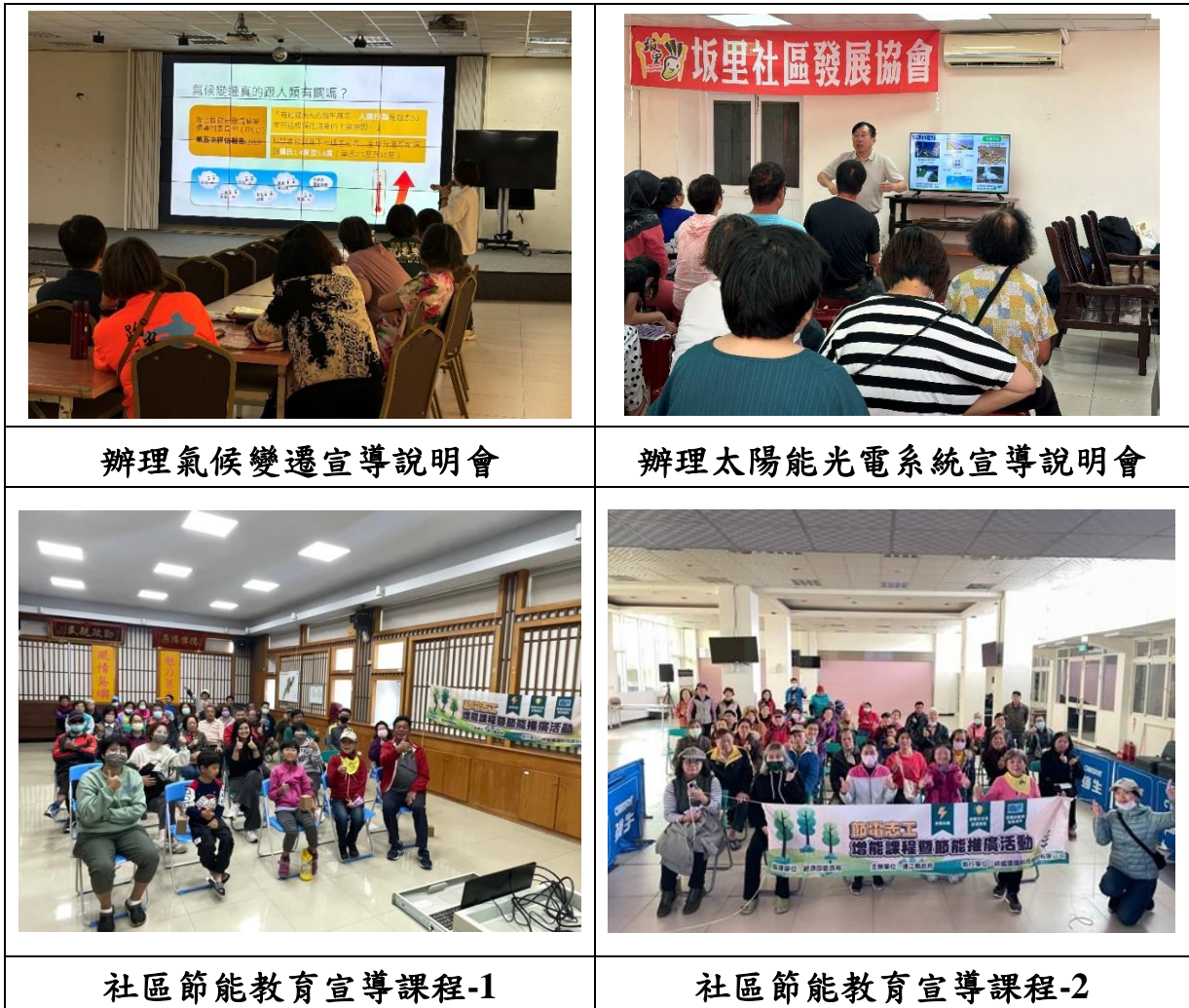
圖 2.3-3 辦理節能相關宣導課程

為因應全球氣候變遷，減少住商部門之能源消耗及碳排放，連江縣政府特於各鄉學校及社區辦理節能相關教育活動。每年亦持續透過節能相關之宣導課程，使地方居民與學生學習如何透過節電以減少實質之碳排放，進一步減緩全球暖化之發生，也培養居民成為未來之節能教育種子學員(如圖 2.3-3 所示)。