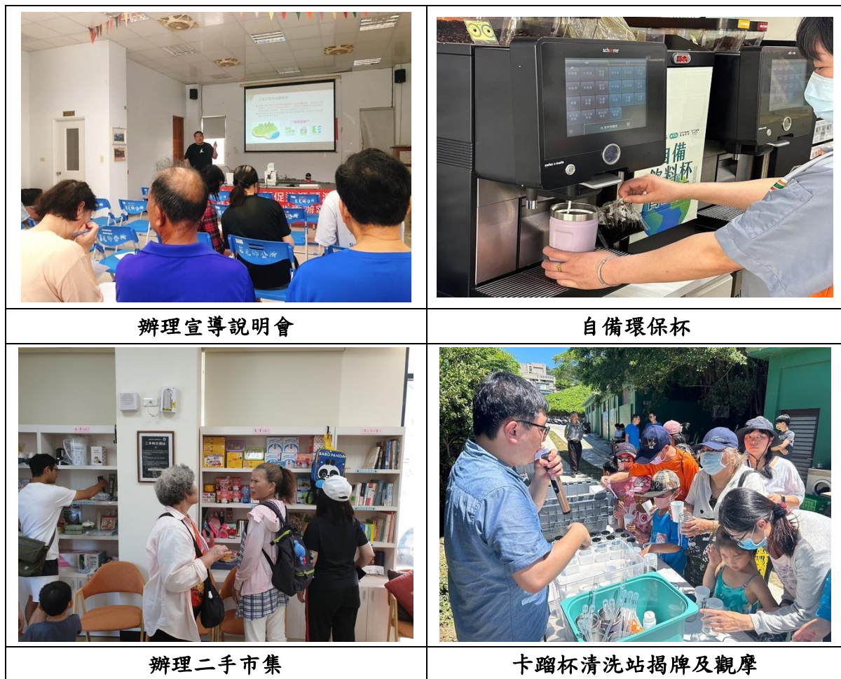
圖 2.3-7 推廣減少廢棄物產生相關宣導活動