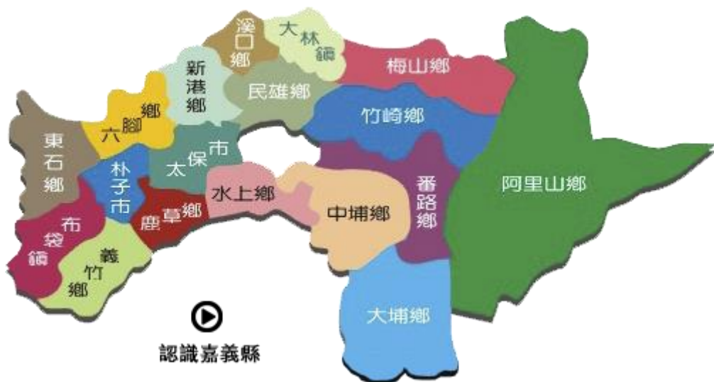
圖 1 嘉義縣行政區域圖

依據表 1 統計資料顯示，轄內行政轄區人口數以民雄鄉 70,266 人為最多，占全縣人口 14.35%，其次為水上鄉 48,107 人占 9.82%以及中埔鄉 43,202 人，占 8.84%，而大埔鄉 4,503 人為最少，占全縣人口之 0.91%。各行政區地理位置如下圖 1 所示。