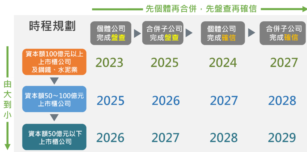
(圖 1：上市櫃公司永續發展路徑圖時程規劃)